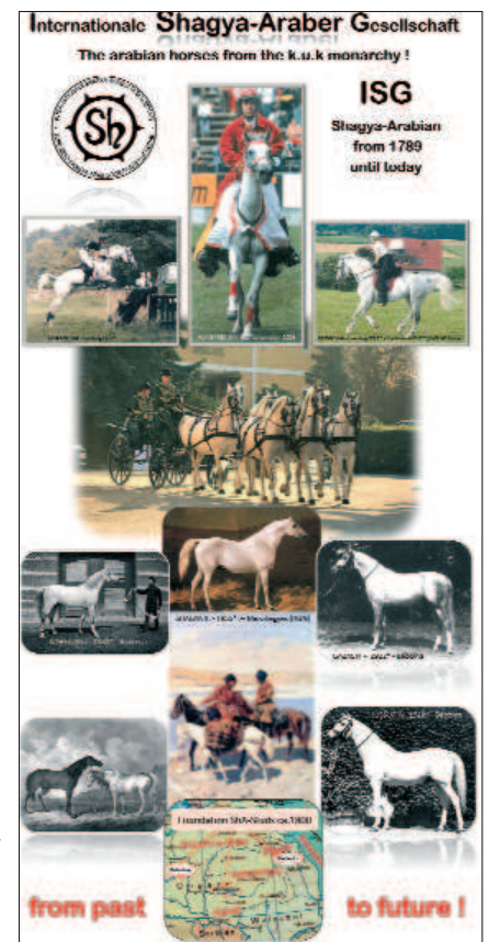
4 roll ups had been created for the ISG information stand at Šamorin.